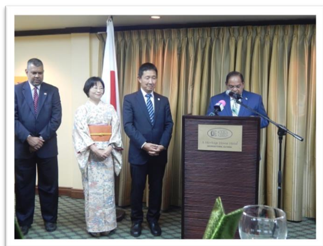
ナガモートー首相によるスピーチ