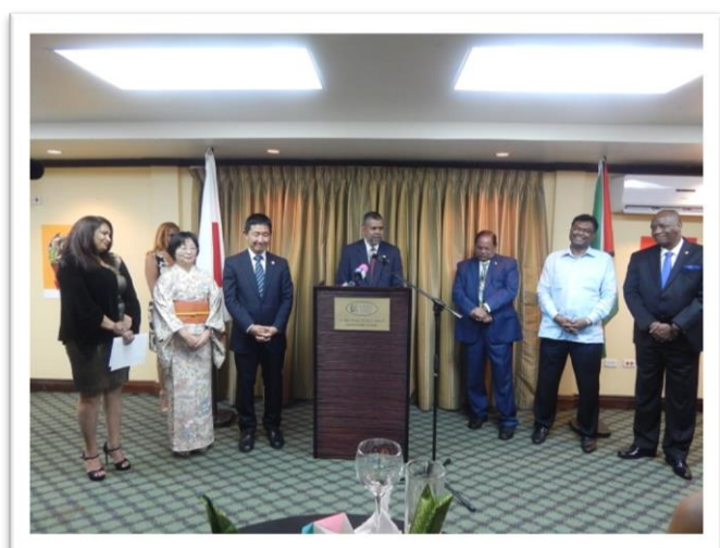
カーン名誉総領事によるスピーチ