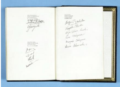
サンフランシスコ平和条約（1951年）