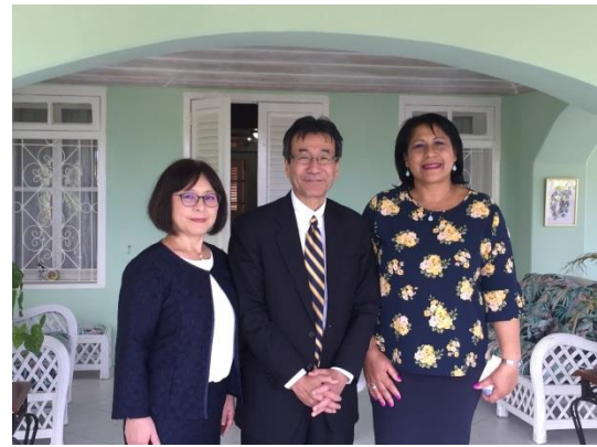
バルデスピノ駐セントビンセント・ キューバ大使兼外交団長表敬