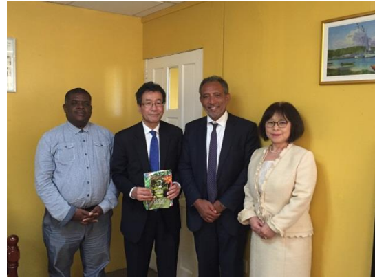
フライデー新民主党党首表敬 (右から: 平山大使夫人、フライデー 党首、平山大使他)