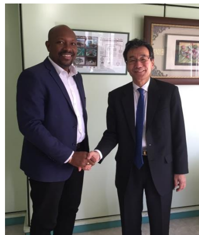
シーザー大臣表敬