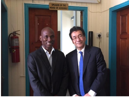
トーマス国会議長表敬