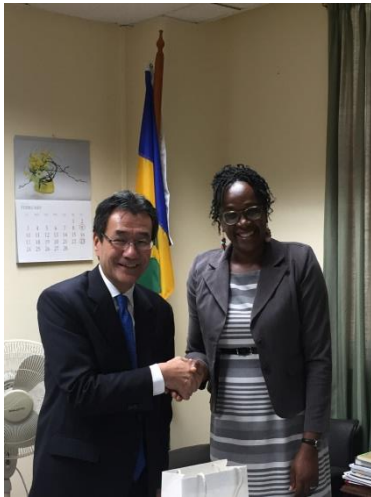
ピーター＝フィリップス外務次官訪問