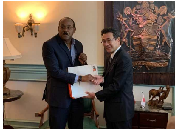
ブラウン首相訪問