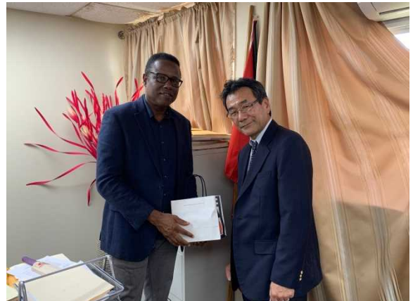
ジョナス農業・漁業大臣訪問