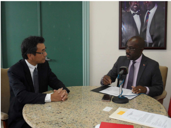
グリーン外務大臣訪問