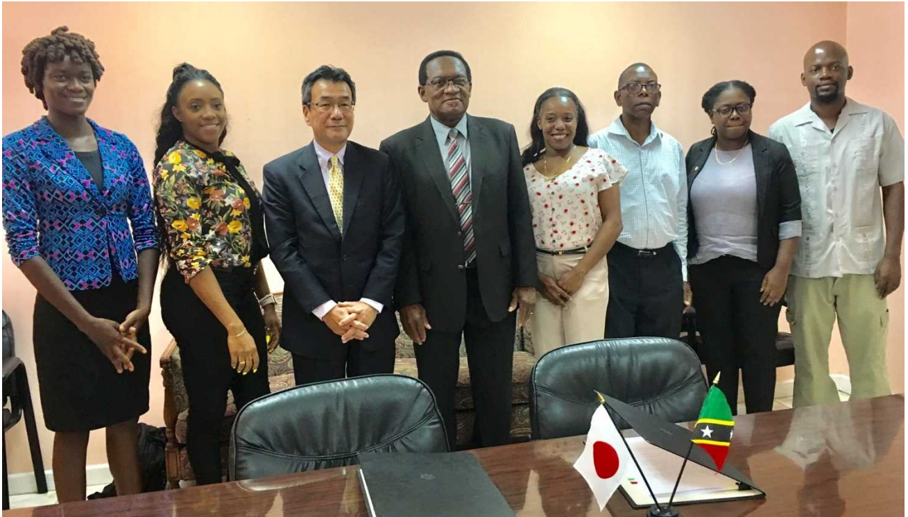
ハミルトン大臣，平山大使（中央）ら出席した関係者

お問い合わせ 在トリニダード・トバゴ日本国大使館 経済・開発協力班 Tel: +(1-868)-628-5991 Ext. 222 E-mail: ecocoop@po.mofa.go.jp