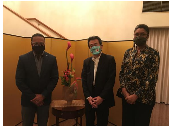
左からブラウン外務大臣、平山大使、トゥーサン外務次官