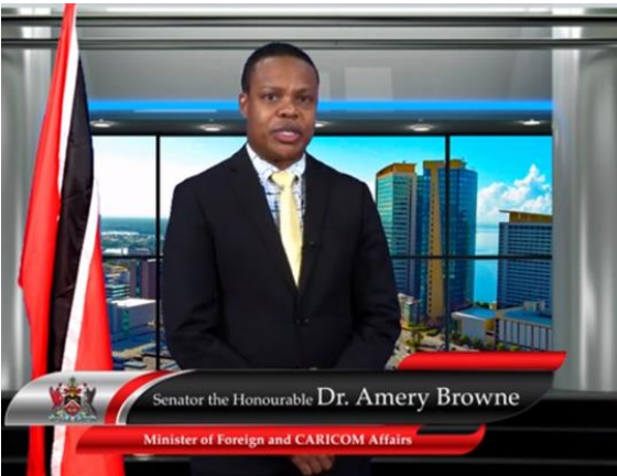
ブラウン外務大臣のビデオメッセージ