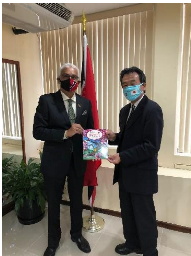
左：デヤルシン保健大臣、右：平山大使

お問い合わせ 在トリニダード・トバゴ日本国大使館 経済・開発協力班 Tel: +(1-868)-628-5991 E-mail: ecocoop@po.mofa.go.jp